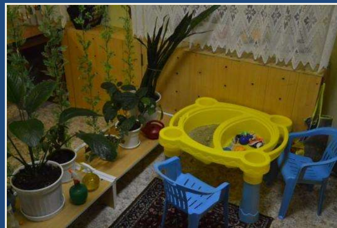
Уголок природы и экспериментирования