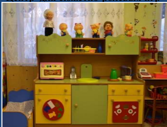
Центр для сюжетно-ролевых игр