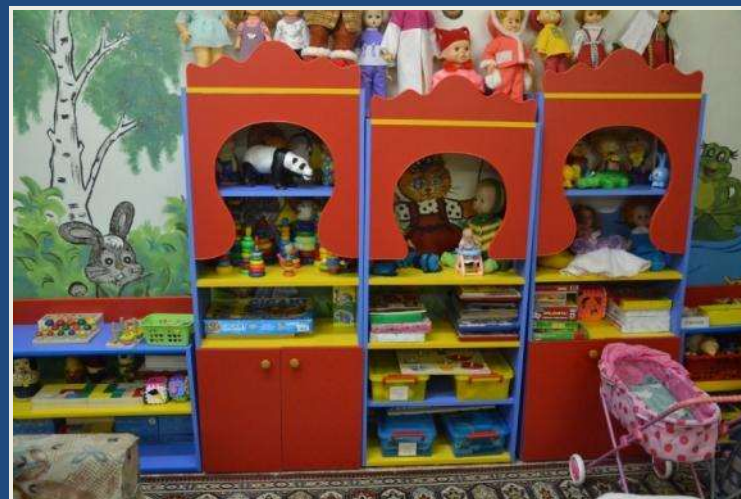
Уголок сенсорных игр