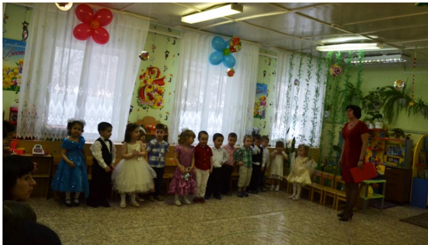
Маму поздравляют малыши!

Известно, что родители и педагоги приобщают ребенка к родному языку, к родной природе, к традициям своего народа, к художественному творчеству. Поэтому третий блок направлен на ознакомление детей и родителей с изобразительной деятельностью, с произведениями детской художественной литературы, а также музыкальными произведениями о маме. Утренник, посвященный Международному женскому дню 8 марта на тему «Маму поздравляют малыши!», подвёл итог работы, где дети и родители прониклись атмосферой доброжелательности, радости, тепла, эмоционального комфорта и благополучия.