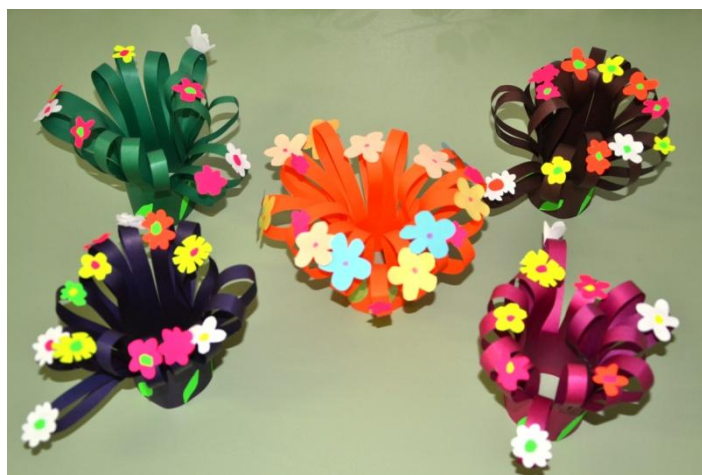
«Вазы из цветов» (цветная бумага) Сунгурова Мария Георгиевна